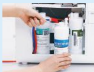
2. Penggantian Filter dan Perawatan