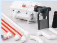
4. Perawatan Setelah Pembelian