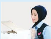
1. Perawatan Reguler Setiap 2 Bulan

Semua produk water purifier Coway telah disertifikasi Water Quality Association (WQA). Beli dengan Paket 7 Tahun , dan nikmati Coway HEART SERVICE™ kami selama 7 tahun.