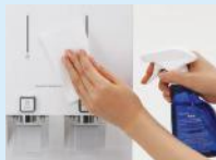
3. Pembersihan dan Sanitasi Produk