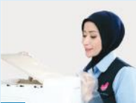
1. Perawatan Reguler Setiap 2 Bulan

Semua produk water purifier Coway telah disertifikasi Water Quality Association (WQA). Beli dengan Paket 7 Tahun , dan nikmati Coway HEART SERVICE™ kami selama 7 tahun.