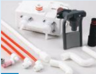
4. Perawatan Setelah Pembelian