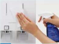
3. Pembersihan dan Sanitasi Produk