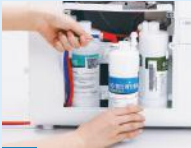
2. Penggantian Filter dan Perawatan