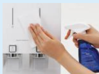
3. Pembersihan dan Sanitasi Produk