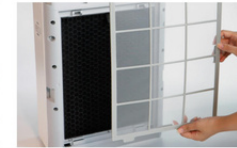
Filter Gratis dan Servis Reparasi