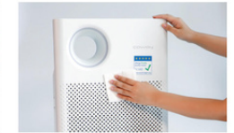
Gratis Instalasi dan Servis Setelah Pembelian

* Keterangan) Pelanggan tidak perlu bertanggung jawab selama kontrak cicilan bulanan sedang berlangsung saat produk rusak, hancur atau hilang. Kami masih akan tetap memperbaiki dan mengganti suku cadang secara gratis. Namun jika pembayaran bulanan Anda terlambat atau belum dibayarkan, layanan Anda akan dihentikan.