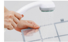
Servis Reguler 2 Bulan

Semua produk air purifier Coway telah disertifikasi Clean Air Certificate (CA). Beli dengan Package 72 , dan nikmati Coway HEART SERVICE™ kami selama 72 bulan.