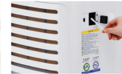
Servis Perawatan Gratis